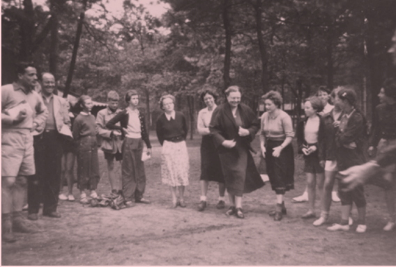
De schoolreisjes van het Maerlant-Lyceum begonnen in de jaren twintig met fietstochten naar Leiden, maar al snel lonkte het buitenland.