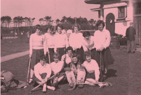
Sport en Maerlant zijn onafscheidelijk. Op de foto het dames-hockeyteam uit 1950.