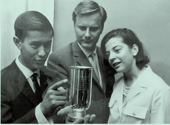
De redactie van Canto maakte een aantal malen de beste schoolkrant van Den Haag. Op de foto de uitreiking van de bijbehorende beker in 1966.